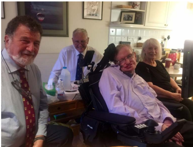
图1所示。2017年6月20日, Remo Ruffini教授和Roy Kerr教授与他的妻子在Stephen Hawking教授位于剑桥的家中共进晚餐,庆祝Kerr度量的Christodoulou-Hawking-Ruffini质量-能量公式