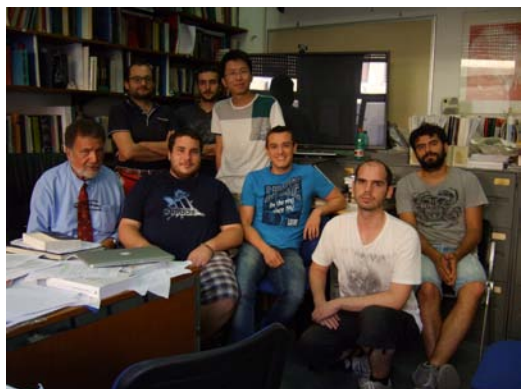
Figura 4: Foto del Prof. Ruffini con i giovani ricercatori che hanno contribuito alla scoperta.

i fotoni, osservati dai vari strumenti, provenienti da questi sistemi che precedono di 8 miliardi di anni la nascita del nostro sistema planetario! Questo sforzo è ben riassunto in 25 ulteriori articoli, che sono citati in quello odierno. Il Prof. Ruffini è stato per molti anni in prima linea in questa ricerca: da “introducing the Black hole” con J.A. Wheeler (vedi Fig. 2), alla scoperta del primo BH con R. Giacconi (vedi Fig. 3), al primo annuncio della scoperta dei GRB con H. Gursky, fino agli sviluppi delle BdHN negli anni recenti con i Proff. C.L. Bianco, J. Rueda e C. Fryer, e con i molti studenti del Dottorato di Ricerca europeo congiunto in astrofisica relativistica, l'IRAP PhD, alla università “Sapienza” di Roma (vedi Fig. 4).