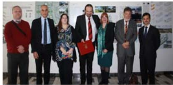
Public lecture by the Director of ICRArNet and official signing of Agreement of Collaboration at the University of Tuzla