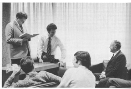
Figura 2: R. Ruffini discute con J.A. Wheeler a Princeton (1971)

miliardi di galassie del nostro Universo: il risultato è un tasso di GRB osservati pari a circa “uno al giorno”, un tasso ideale per poter svelare la loro natura sulla base delle teorie di Einstein (vedi Fig. 1). In tutto ciò è stato essenziale lo sforzo osservativo nei raggi X e gamma compiuto grazie a missioni spaziali (come ad esempio BeppoSAX, SWIFT, FERMI) con una forte presenza europea, e grazie agli osservatori ottici come l'ESO VLT europeo e il KECK americano. Cruciale è stato lo sforzo teorico compiuto dall'ICRANet per attribuire un significato astrofisico a tutti