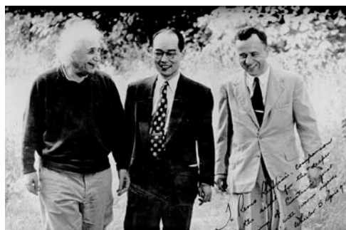
Figura 1: Da sinistra a destra: A. Einstein, H. Yukawa, J.A. Wheeler

La pietra miliare nella comprensione della natura dei Gamma-Ray Burst (GRB, in italiano “lampi di raggi gamma”) presentata oggi sulla prestigiosa rivista scientifica The Astrophysical Journal da scienziati di ICRA/ICRANet all'Università “Sapienza” (vedi: https://arxiv.org/pdf/1704.03821.pdf ) mostra come i GRB abbiano origine dai sistemi più complessi mai studiati in fisica e in astrofisica e più potenti, dal punto di vista energetico, nell'intero Universo. “In soli 100s una supernova (SN) è osservata esplodere e accrescere in maniera ipercritica, a un tasso di circa 1 massa solare al secondo, su una stella di neutroni (NS) compagna molto vicina. In sequenza, la NS, dopo aver raggiunto la massa critica, collassa gravitazionalmente formando un “black hole” (BH) ed emettendo un GRB. Il GRB sbatte contro il materiale espulso dalla SN, emette un segnale nei raggi X e nei raggi gamma, e trasforma la SN in una “ipernova”. Questa “matrice cosmica”, chiamata “Binary-driven-hypernova” (BdHN), è la più energetica di sette sottoclassi di GRB”. I GRB sono gli oggetti più luminosi nell'intero Universo, e possono quindi essere osservati da una distanza di 10 miliardi di anni luce nel nostro cono di luce del passato: le loro luminosità sono pari alla luminosità totale di tutte le stelle del nostro Universo, cioè alla luminosità di 100 miliardi di miliardi di Soli messi insieme! Un GRB si verifica in media una volta ogni 100 milioni di anni in ciascuna galassia, ed è visibile da tutti i