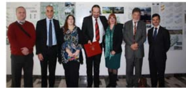
Javno predavanje Direktora ICRArNet-a i potpisivanje Sporazuma o suradnji na Univerzitetu u Tuzli