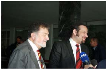
Mediji o PMF-u i ICRArNet-u